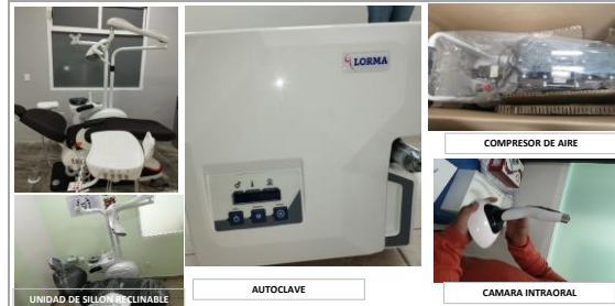
UNIDAD DE SILLÓN RECLINABLE