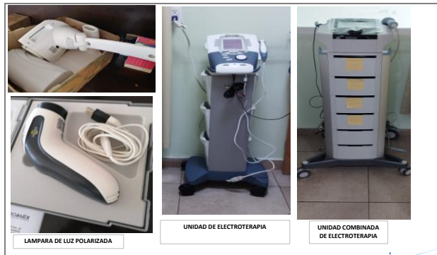
LAMPARA DE LUZ POLARIZADA