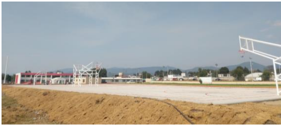
F3: Fachada posterior