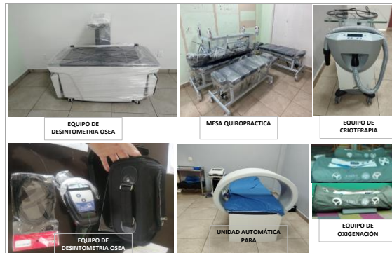
EQUIPO DE DESINTOMETRIA OSEA