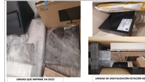
UNIDAD QUE IMPRIME EN SECO