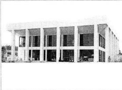
F1: Fachada principal