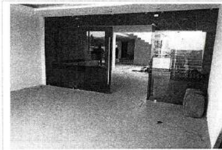
F5: Interior de obra